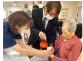
あけましておめでとう