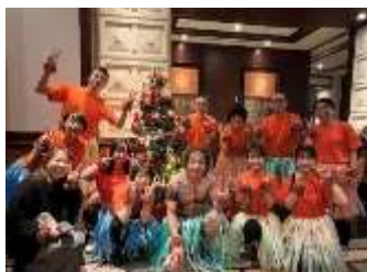
ケアマネみんなで忘年会参加

「一つひとつの出来事に対して、利用者様やご家族と一緒に考え、寄り添った対応を心がけています。」