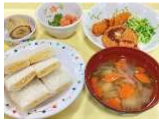
クリスマスメニュー