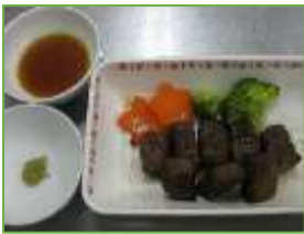
サイコロステーキ